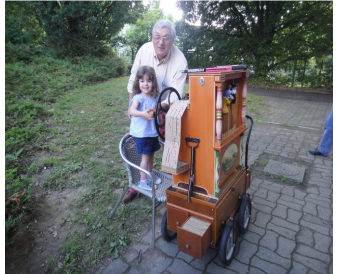
(Soirée des Adhérents du 7 Juin 2018)